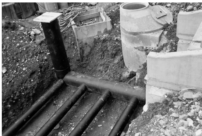
Scambiatore interrato in costruzione

Uno dei sistemi per contenere i consumi di energia potrebbe essere l'impiego di scambiatori interrati. Prima di affrontare l'argomento, vorrei brevemente ricordare che un edificio passivo offre un elevato comfort abitativo, con un fabbisogno termico annuo di meno di kWh/m 2 . Ciò consente non solo di rinunciare ad un sistema di riscaldamento convenzionale, ma anche di fornire il calore ancora necessario tramite l'aria, cioè tramite un sistema di ventilazione controllata. Esperienze con molti di questi edifici sono state fatte nell'Europa centrale, queste tuttavia possono servire principalmente in regioni italiane con un clima relativamente rigido. Nelle regioni del Centro e del Sud il problema della climatizzazione ha due facce, in quanto ha rilevanza non solo il riscaldamento invernale, ma anche il raffrescamento estivo. In un edificio passivo si possono risolvere questi due problemi con la stessa tecnologia, cioè con il sistema di ventilazione collegato ad uno scambiatore interrato (Subsoil Heat Exchanger - SHE).