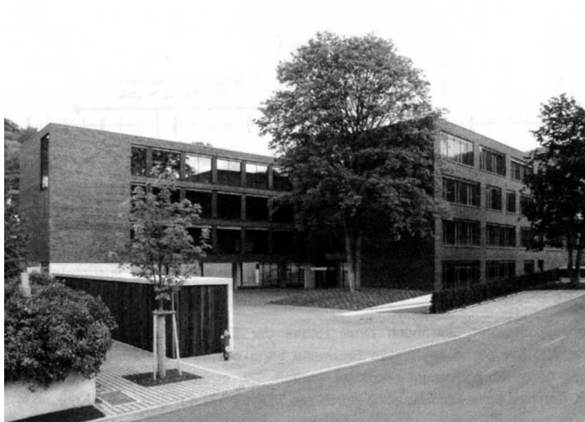
Figura 1 – La scuola Justus-von-Liebig di Waldshut

Di Volker Weiß & Dirk Jakob, traduzione Uwe Wienke