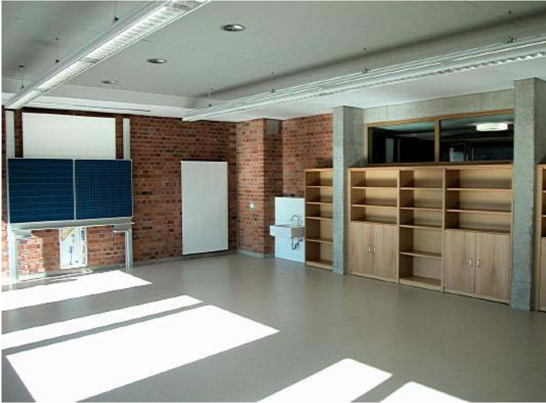
Interno di un'aula scolastica