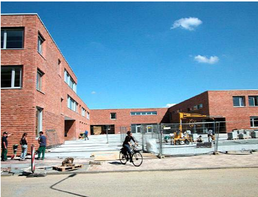
La scuola vista dalla strada