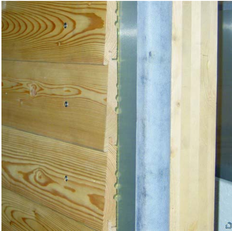
Pannello termoisolante sottovuoto con traforo predisposto per far passare il raccordo di collegamento.