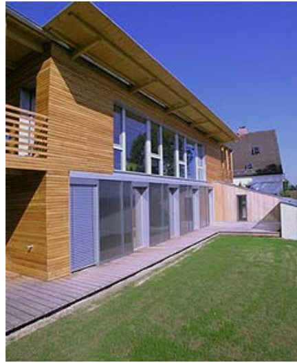
Le finestre e il sistema di ombreggiamento sulla facciata esposta a sud