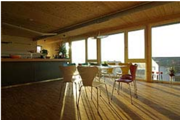
Il primo piano con la cucina e il soggiorno

L'impermeabilità dell'edificio (0,4 h/1) è stata misurata alla fine dei lavori di costruzione. L'indice d'energia primaria necessaria per la produzione d'acqua calda, riscaldamento e altri usi domestici è stato calcolato con PHPP a 90 kWh/m 2 a. La metà di questo consumo riguarda le utenze domestiche.